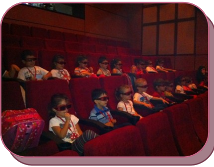
3 boyutlu sinemadayız