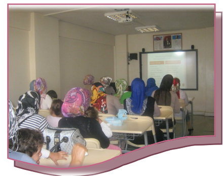
Dumlupınar Sağlık Polikliniğinden Aile Planlamasının Önemi...