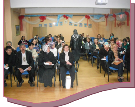
Kadıköy Belediyesi Çocuk Koruyucu Ruh Sağlığından Bireysel Danışmanlık ve Terapi Hizmetleri