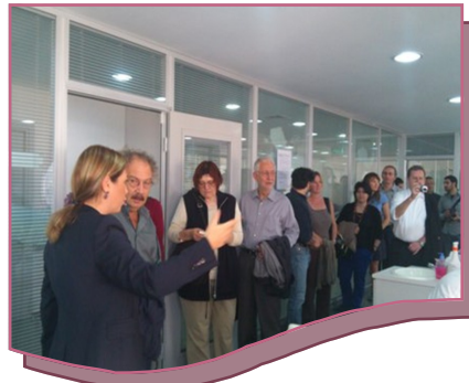
Kardeş Belediyemiz Kreuzberg Belediyesinden Gelen Resmi Heyet Ziyareti