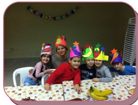
Yerli Malı Haftası