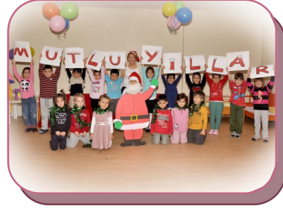
Yeni Yıl Kutlamaları