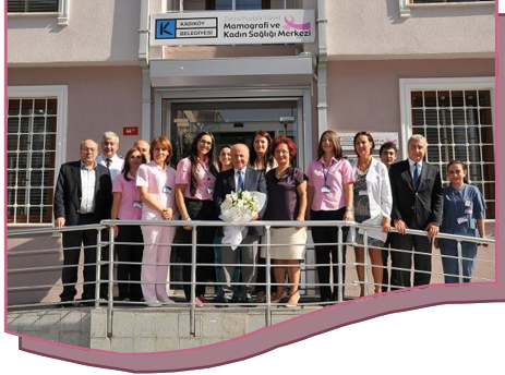
Kadıköy Belediyesi Kadın Sağlığı ve Mamografi Merkezi 1 Yaşında...